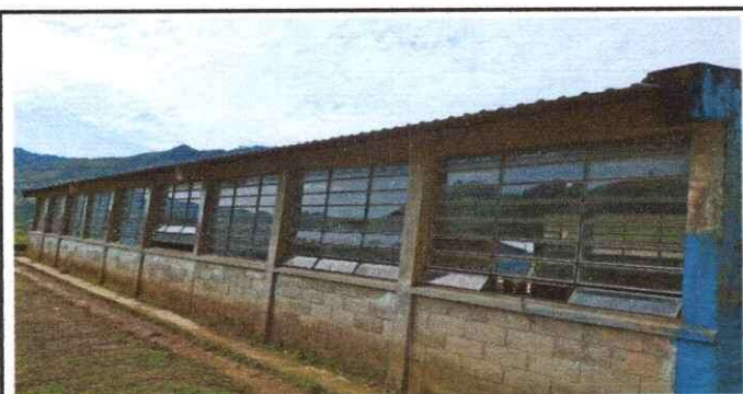
Foto 11: Rehabilitación de canales del establecimiento educativo.