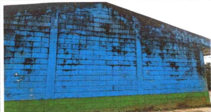
Foto1: Vista panorámica de la necesidad de aplicación de pintura en paredes interiores y exteriores.