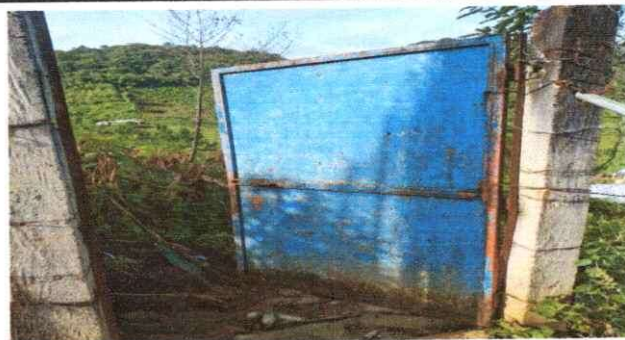
Foto 6: Sustitución del portón del establecimiento educativo en mal estado.

Observación: Si es necesario se pueden agregar hojas adicionales y actualizar el número de hojas.