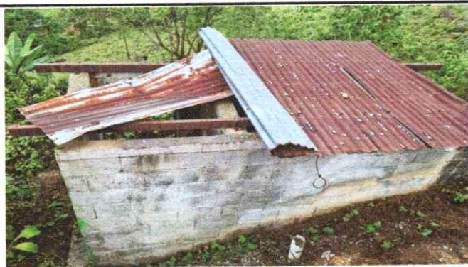
Foto 4: Sustitución del techo de los baños, mantenimiento de estructura y aplicación de pintura.