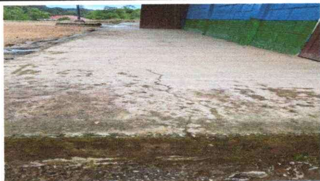
Foto 3: Sustitución del piso entortado por piso cerámico del establecimiento educativo.